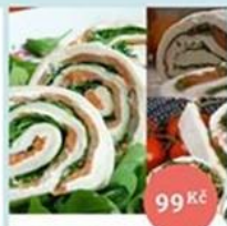
Roláda z mozzarellly di Antonio s pršutem a 99 Kč