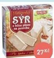
Sýr s bílou pláští, 100 g 27 Kč