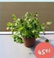
Koriandr v květináč 45 Kč