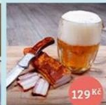
Staročeský bůček k pivu, 400-500 g 129 Kč

Objednejte si online na Scuk.cz/horicenasumave a vyzvedněte na adrese Hořice na Šumavě 11.