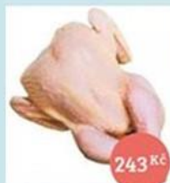
Farmářské kuře chlazené, 1,5-1,7 kg 243 Kč