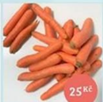
IPZ piletická karotka, min. 1 kg 25 Kč